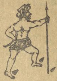
Mangadathon Adat Batak (M. A. B.)

App. boeaton ni modil ndang holan toe lapo parkopian be soerpoesoerpoe noenga lam rarat langkana dohot toe la po parbakmian ni Sina.